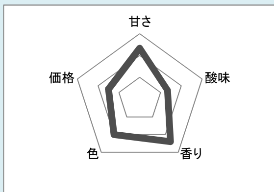
商品③ インド(Freshtrop社) アルフォンソ種(高压低温殺菌品)