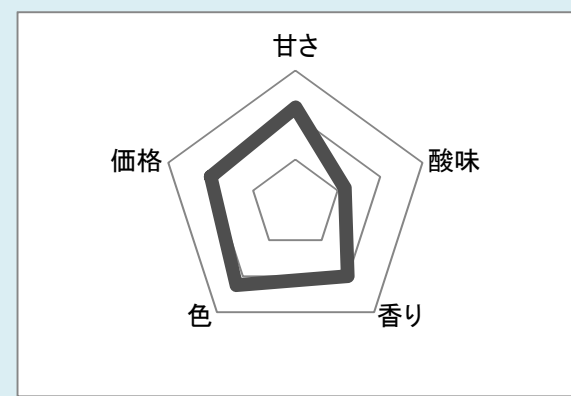
商品② インド(F&I社) アルフォンソ種